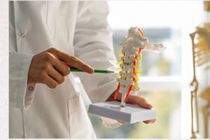
ORTOPEDIA / TRAUMATOLOGIA